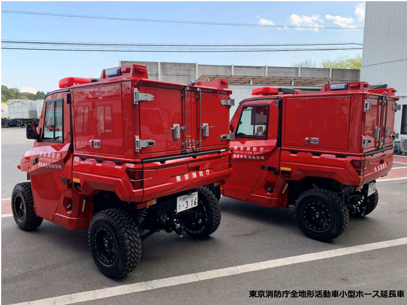
東京消防庁全地形活動車小型木一入延長車