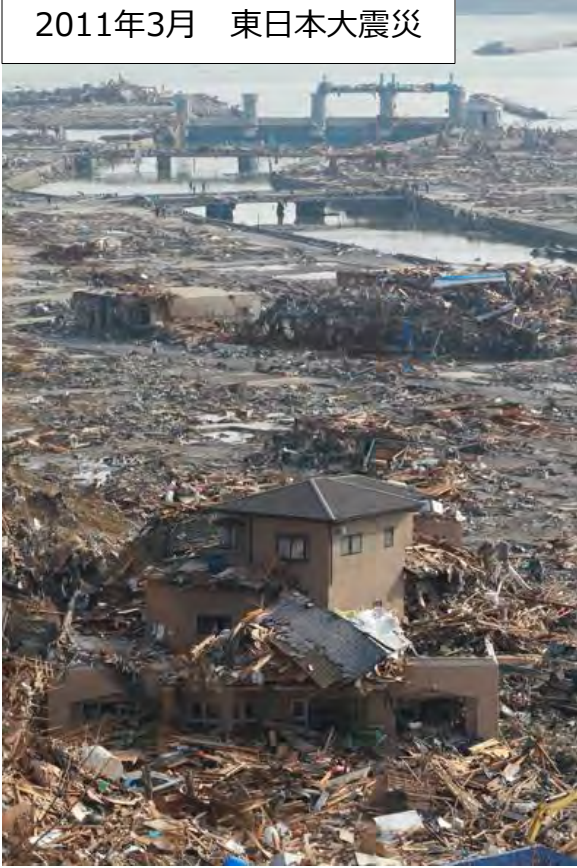
2011年3月 東日本大震災