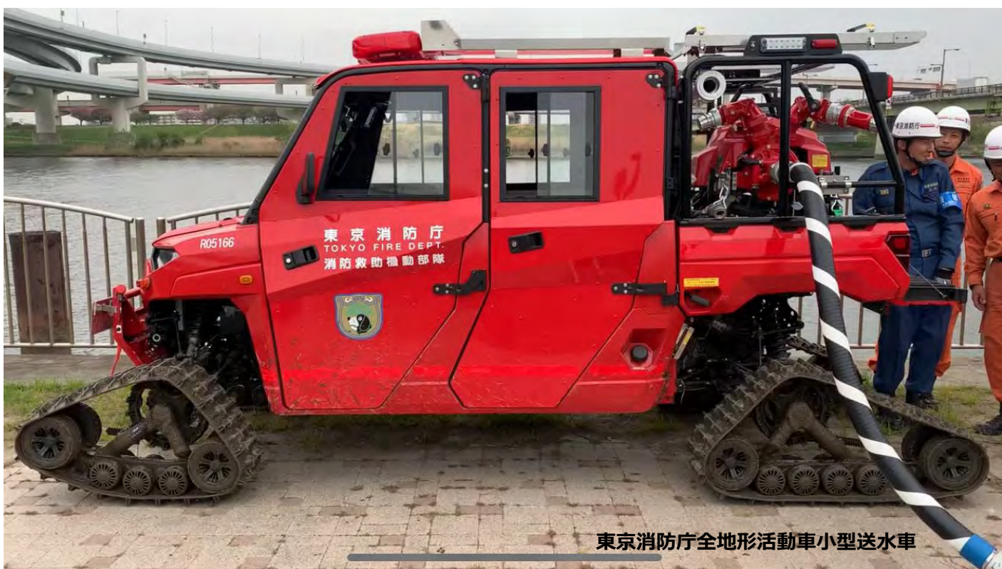
東京消防庁全地形活動車小型送水車