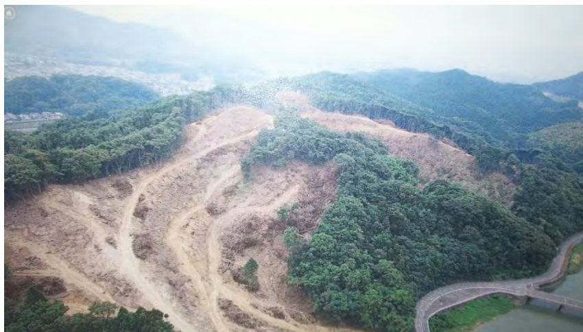
震災地すべりによる啓開前の道路縦断