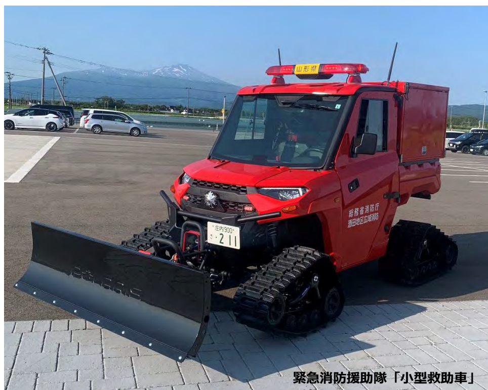
緊急消防援助隊「小型救助車」